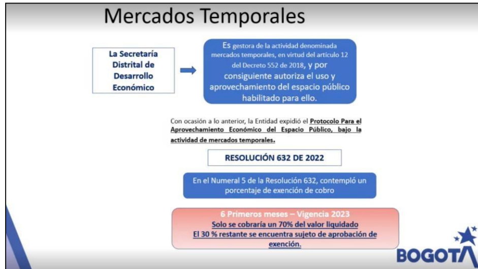
Imagen 1. Extracto presentación exención Mercados temporales 30% (SDDE)

De igual manera Angélica Segura realizó las siguientes precisiones respecto de la actividad: