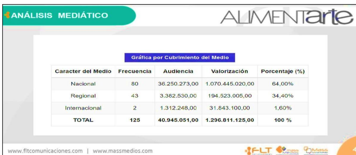
Imagen 4. Extracto solicitud exención “Alimentarte Food Festival 2023” (SDDE)

En cuanto a la cobertura de medios obtenida por Alimentarte Food Festival en febrero 2023 la cuantificación del beneficio tuvo como resultados: $ 1.296.811.125.