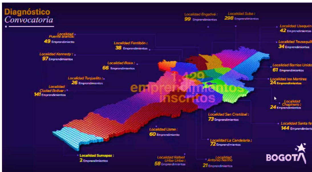
Imagen 2. Mapeo de emprendimientos diagnosticados para la convocatoria por localidad, extracto presentación solicitud de exención, Feria Bogotá es Navidad 2023 (SDCRD).

Categorías de productos presentes en la feria: