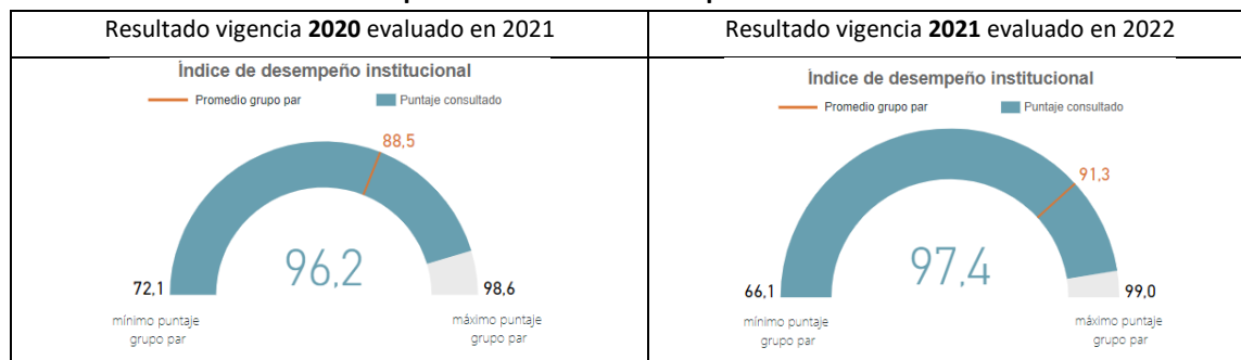
Gráfica No. 1. Comparativo índice de desempeño institucional 2020 vs 2021

Consultados los resultados del desempeño institucional publicados en la página web de MIPG, para las vigencias 2020 y 2021, se encontraron los siguientes indicadores. Ver gráfica No. 1.