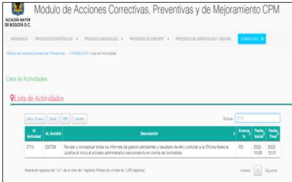
Imagen No.6. Verificación en el Módulo de Acciones Correctivas, Preventivas y de Mejoramiento CPM