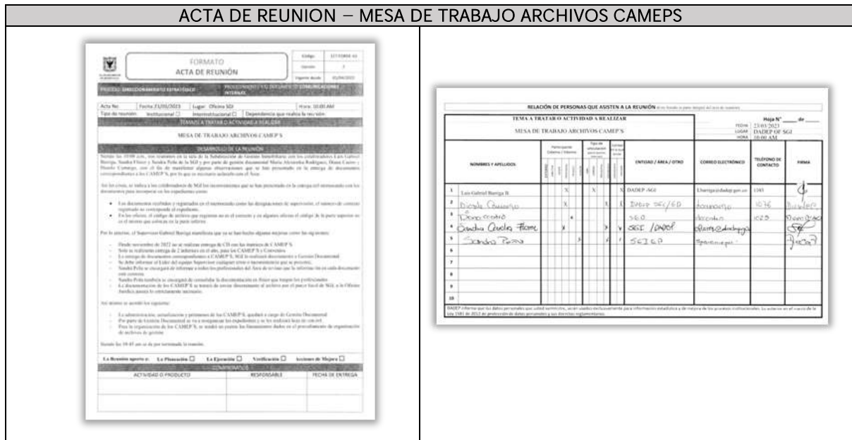
Imagen No.4- Evidencia de la reunión sostenida con los supervisores de los Contratos CAMEPS.