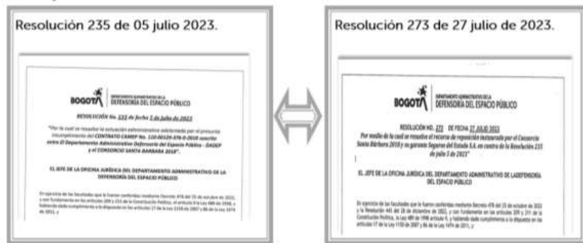
Tabla No.8- Resoluciones por medio de la cual se declaro incumplimiento al Contrato No.110-00129-376-0-2018 y por medio de la cual se instauró el recurso de reposición instaurado por el Consorcio Santa Barbara 2018

De otra parte este contrato de administración, mantenimiento y aprovechamiento económico tiene fecha de inicio de 08 de enero del 2019 por parte del DADEP al representante legal Consorcio Santa Bárbara 2018, cuyo objeto inicial radicó en contratar la administración, mantenimiento y aprovechamiento económico de las de zonas de uso público asociadas al presente proceso de contratación, mediante el desarrollo de actividades que propendan por su preservación, buen uso, disfrute colectivo y sostenibilidad.