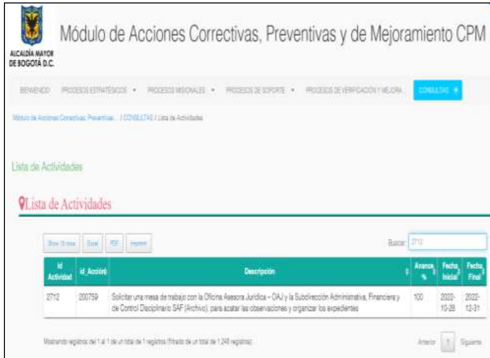
Imagen No.2- Verificación en el Módulo de Acciones Correctivas, Preventivas y de Mejoramiento CPM