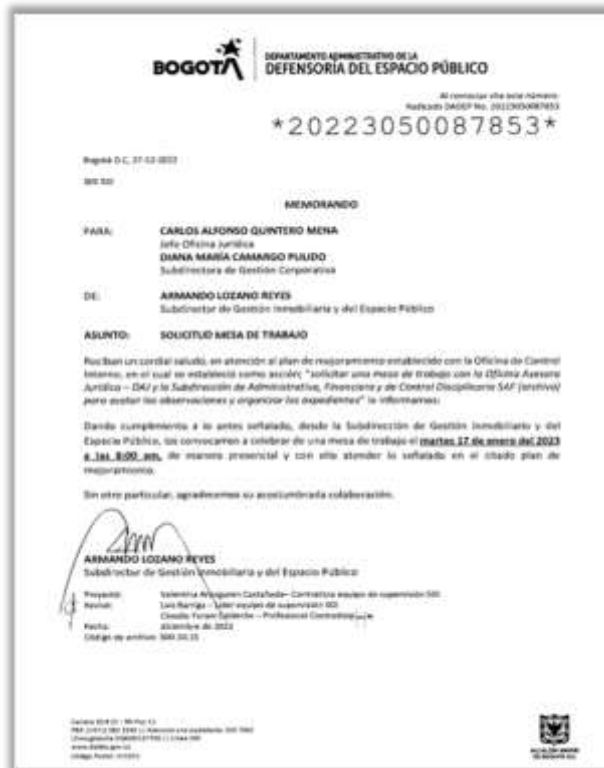
Imagen No.3 -Memorando Solicitud Mesa de Trabajo con Radicado No. 20223050087853

Fuente: http://cpm.dadep.gov.co:8080/MECI_CPM-Portlets/files/167241393573420223050087853.pdf