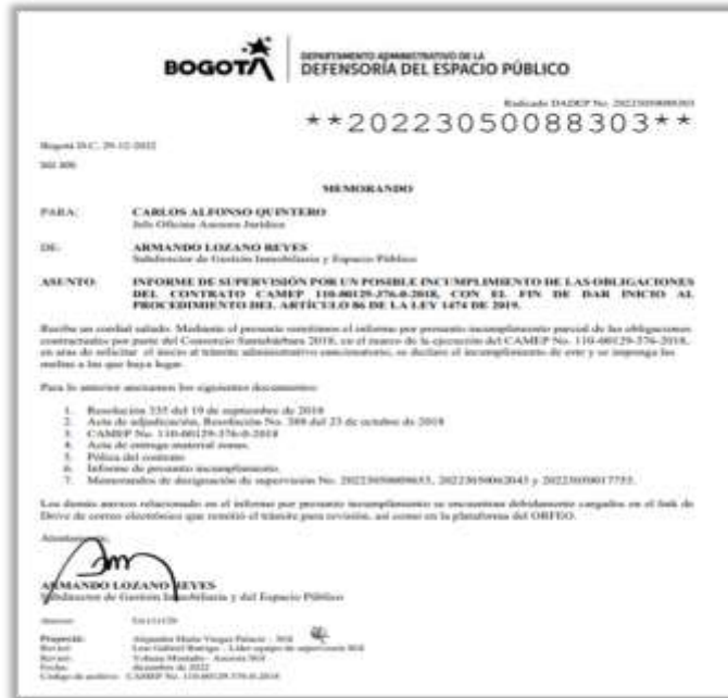
Imagen No.7 - Radicado No. 20223050088303

Fuente: http://cpm.dadep.gov.co:8080/MECI_CPM-Portlets/files/1672414574594Rad.%2020223050088303%20memo%20OAJ%20IPI%20(1).pdf