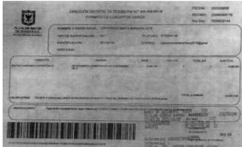
Imagen No.8-Soporte de pago multa y sanción contractual