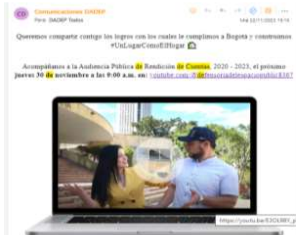
Imagen 10. ¡Te esperamos! Rendición de Cuentas, 2020 - 2023

Fuente: https://www.youtube.com/watch?v=pv0RwBOSUuk