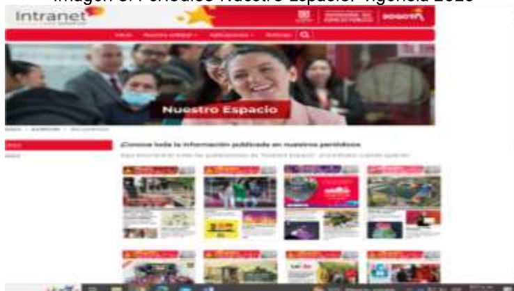
Imagen 8. Periodico Nuestro Espacio/ vigencia 2023