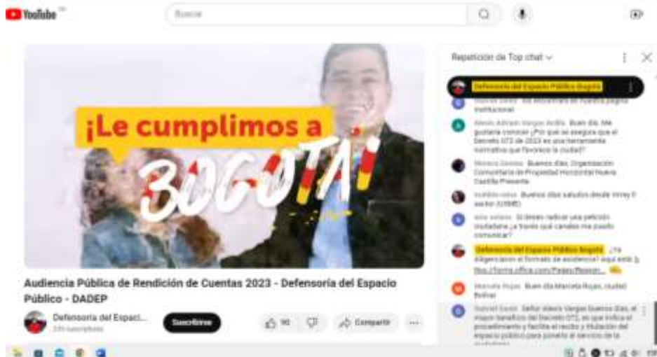
Imagen 9. Canales Externos de comunicación - Redes Sociales DADEP/ YOUTUBE