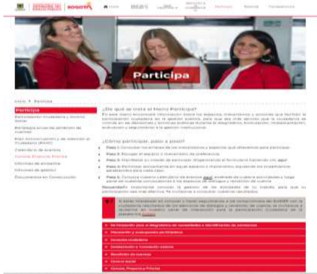
Imagen 5. Transparencia- Participa