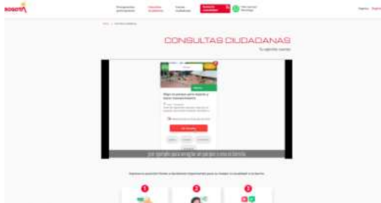
Imagen 7. Bogotá Participa- Consultas Ciudadanas