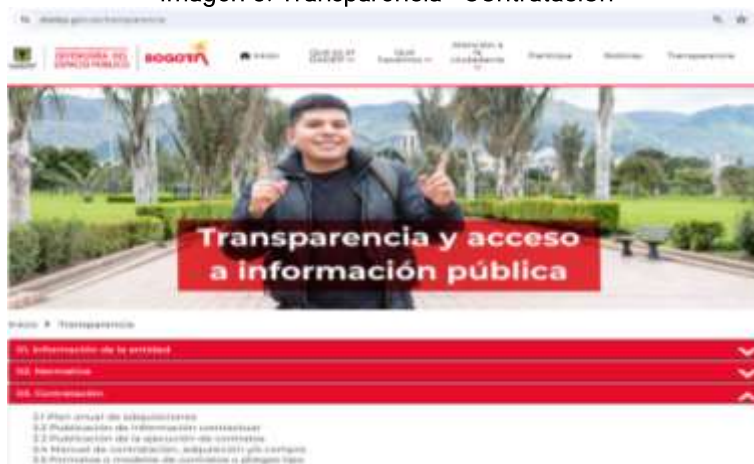
Imagen 3. Transparencia- Contratación