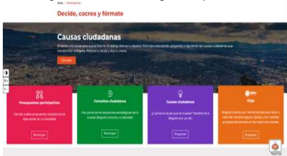
Imagen 6. Gobierno Abierto de Bogotá-Participación