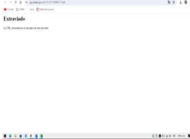
Imagen 4. Formato Pliego de condiciones - Selección abreviada de menor cuantía Subasta