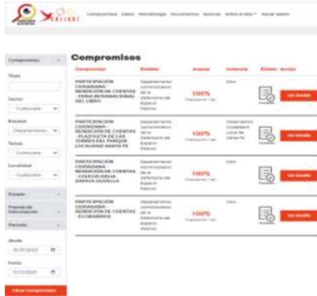
Imagen 11. Compromisos 2023 Veeduría Distrital-Colibri