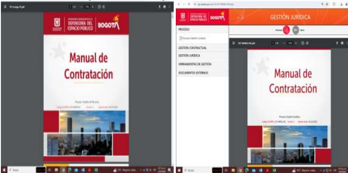
Imagen 1. Publicación Pagina web externa e interna DADEP