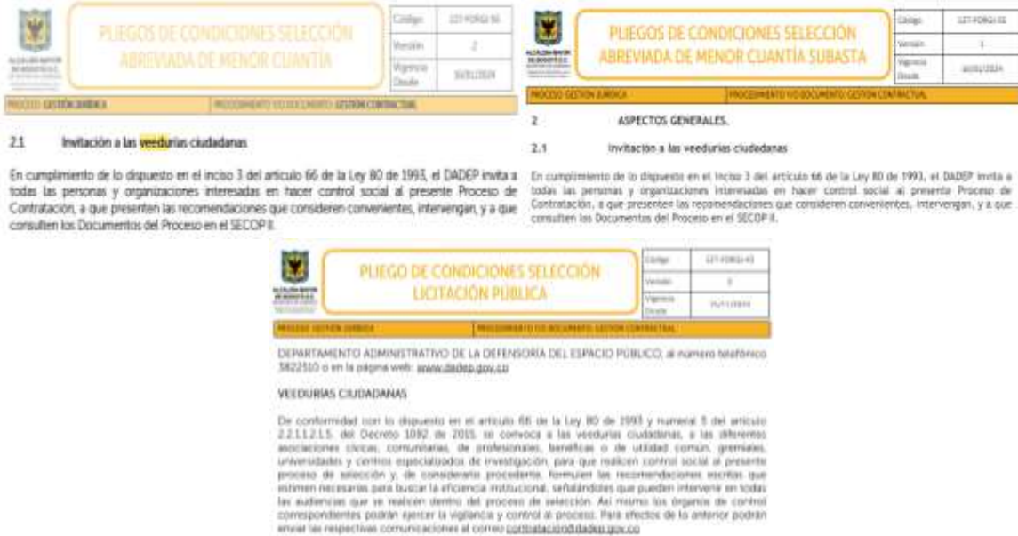
Imagen 2. Invitación Veedurías Ciudadanas