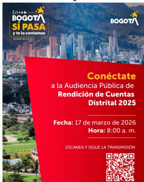
Rendición de cuentas Distrital 2025