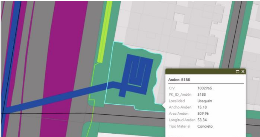
IMAGEN No. 01 - MAPA DE IDENTIFICACION DE ESPACIOS

ARTÍCULO SEGUNDO - DELIMITACION DE LOS ESPACIOS: La actividad autorizada será realizada en los términos del Documento Técnico de Soporte aprobado por el DADEP sobre los siguientes espacios públicos: