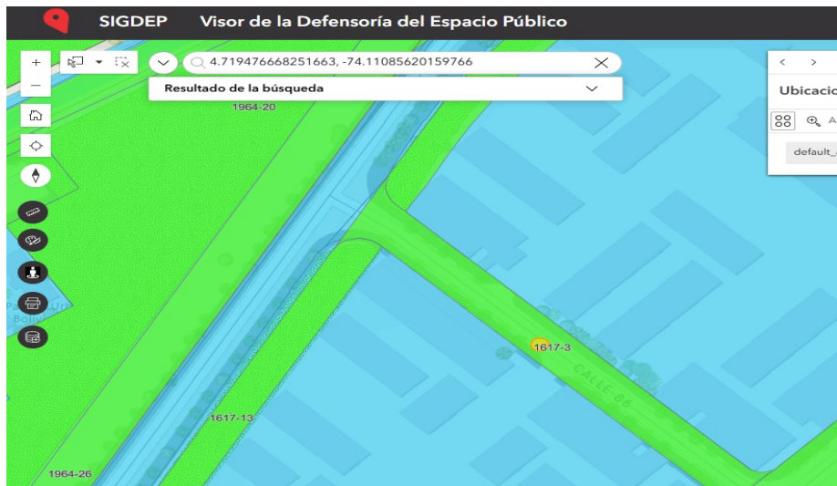
imagen 1 - Fuente: Captura de imagen tomada de https://sigdep.dadep.gov.co/

Las funciones policivas están bajo la responsabilidad de las Alcaldías Locales, de acuerdo con el artículo 86 del Decreto 1421 de 1993, modificado por la Ley 2116 de 2021, artículo 11. numeral 9 dispone: "(...) Dictar los actos y ejecutar las operaciones necesarias para la protección, recuperación y conservación del espacio público, el patrimonio cultural, arquitectónico e histórico, los monumentos de la localidad, los recursos naturales y el ambiente, con sujeción a la ley, a las normas nacionales aplicables, y a los acuerdos distritales y locales (...)".