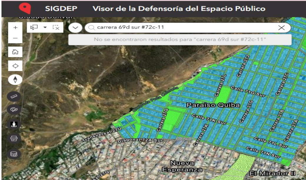
imagen 1 - Fuente: Captura de imagen tomada de https://sigdep.dadep.gov.co/

Una vez verificado en el SIGDEP y SINUPOT la nomenclatura carrera 69d sur #72c-11, no existe