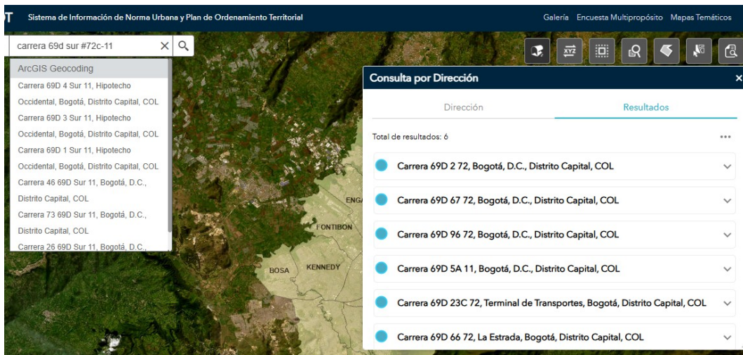
imagen 1 - Fuente: Captura de imagen tomada de https://sigdep.dadep.gov.co/

Por lo cual respetuosamente se le solicita que, en marco de la ley 1755 de 2015, "(...) ARTÍCULO 17. Peticiones incompletas y desistimiento tácito (...) ", se de alcance al