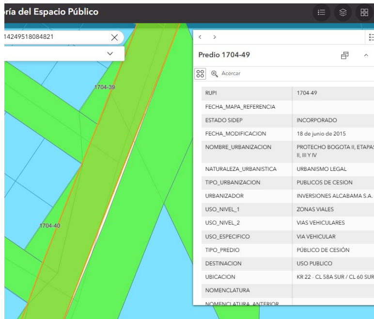
imagen 1 - Fuente: Captura de imagen tomada de https://sigdep.dadep.gov.co/

Es importante resaltar las funciones policivas en cabeza de las Alcaldías Locales, en virtud de lo establecido en el Decreto 1421 de 1993 modificado por la Ley 2116 de 2021, artículo 11. numeral 9 dispone: "(...) Dictar los actos y ejecutar las operaciones necesarias para la protección, recuperación y conservación del espacio público, el patrimonio cultural, arquitectónico e histórico, los monumentos de la localidad, los recursos naturales y el ambiente, con sujeción a la ley, a las normas nacionales aplicables, y a los acuerdos distritales y locales (...)".