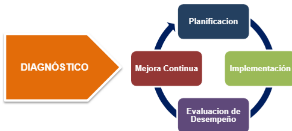
Ilustración 1. Ciclo de Operación