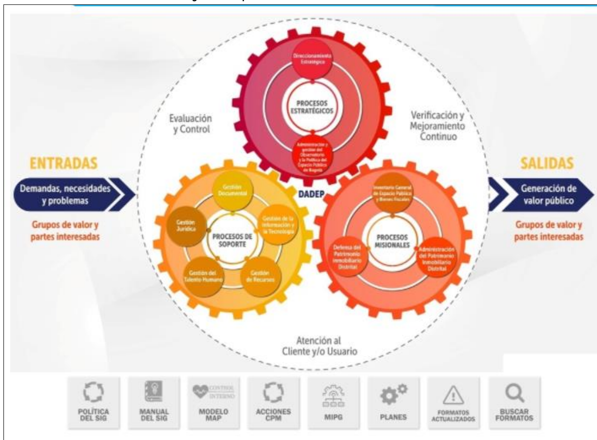
Imagen 1 - Mapa de Procesos del Sistema de Gestión