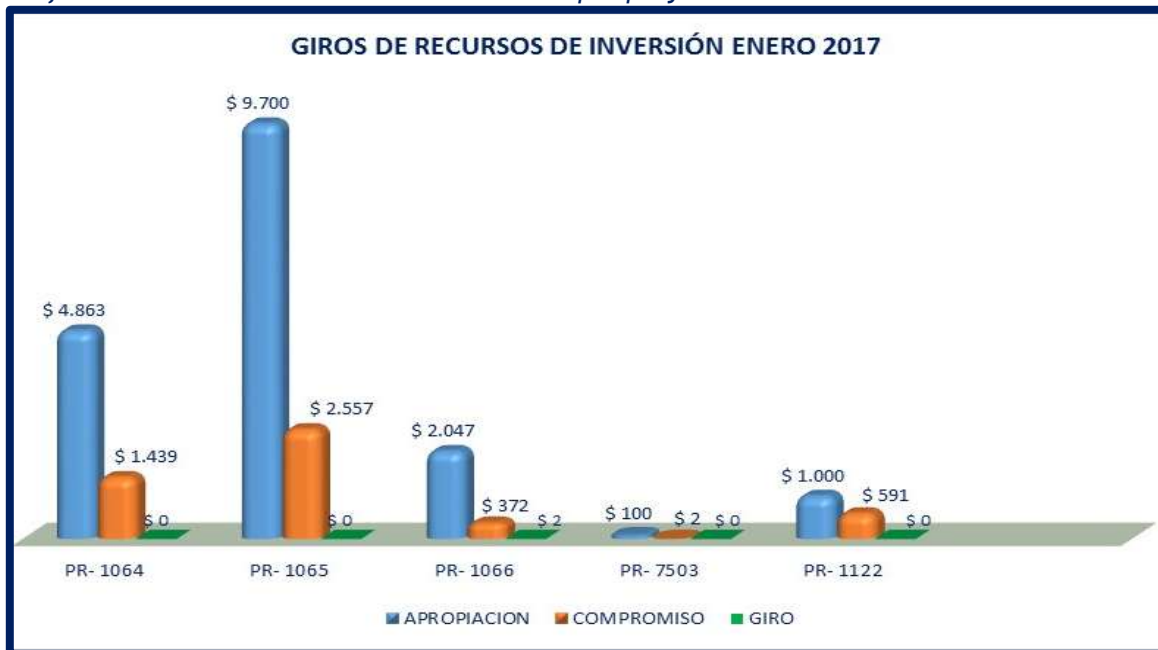
Gráfica No. 04. Giros de Recursos de Inversión por proyecto 31-enero 2017