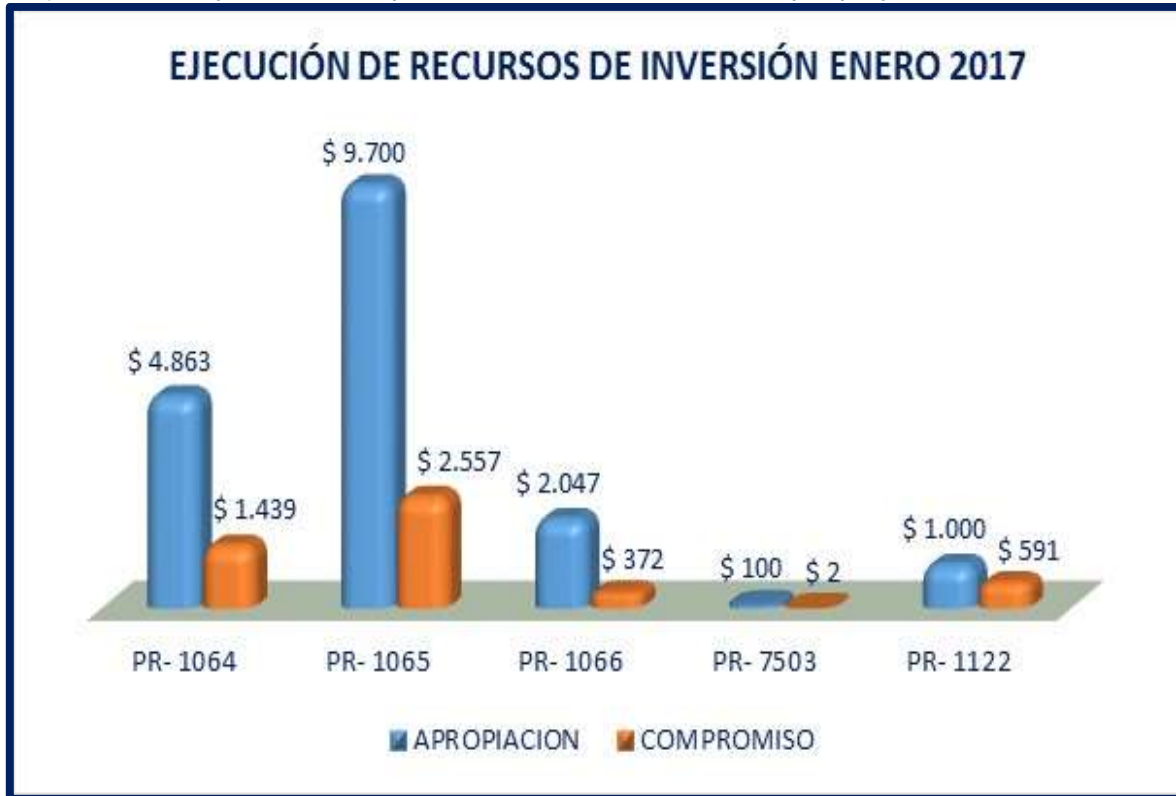
Gráfica No. 03. Ejecución Presupuestal de Recursos de Inversión por proyecto 31-enero 2017