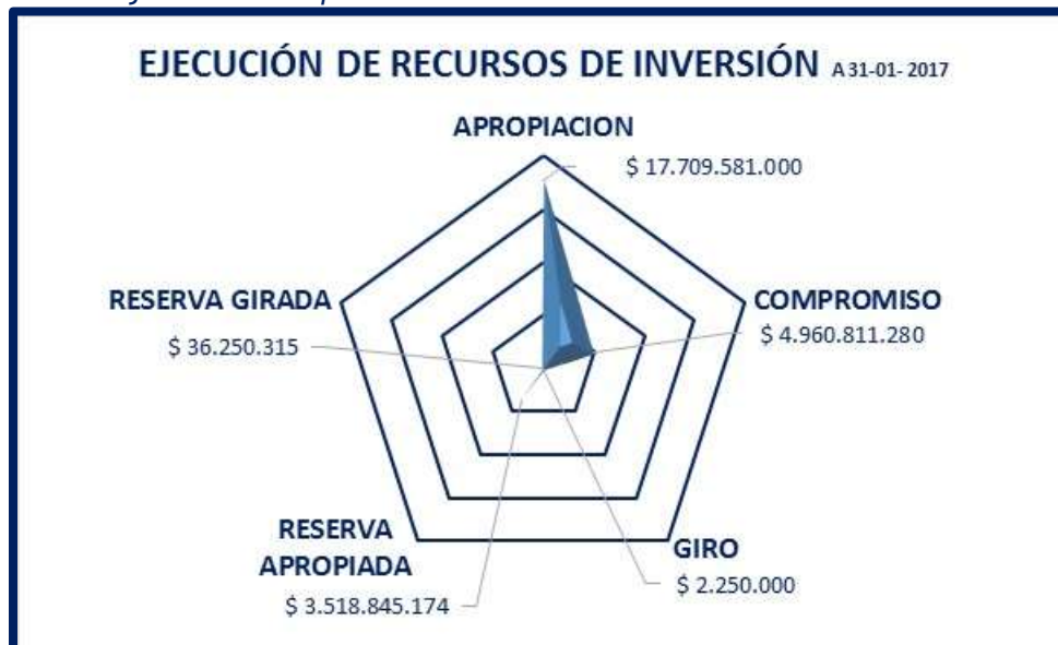
Gráfica No. 02. Ejecución Presupuestal de Recursos de Inversión 31-enero 2017